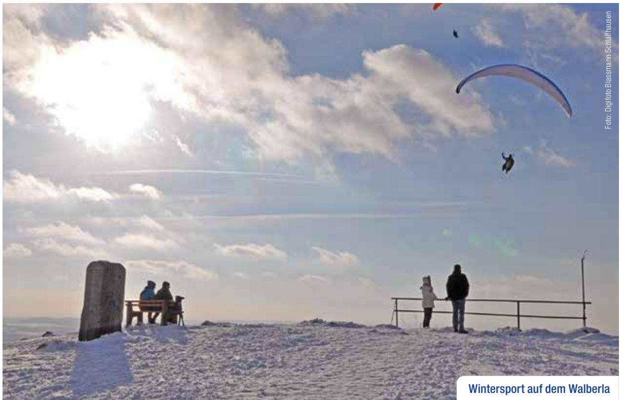
Wintersport auf dem Walberla