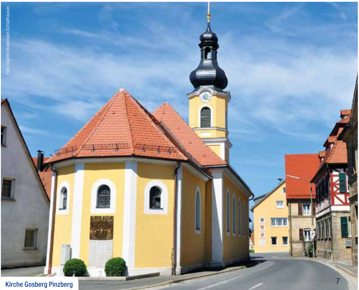
Kirche Gosberg Pinzberg