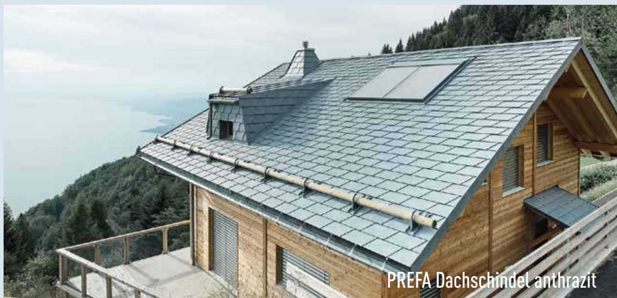
PREFA Dachschindel anthrazit