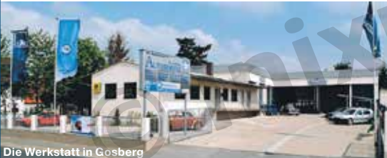
Die Werkstatt in Gosberg

Gosberger Str. 27 · 91361 Gosberg · Tel.: 091 91/797525 · Fax: 091 91/797526 · info@tommisautoservice.de · www.tommisautoservice.de