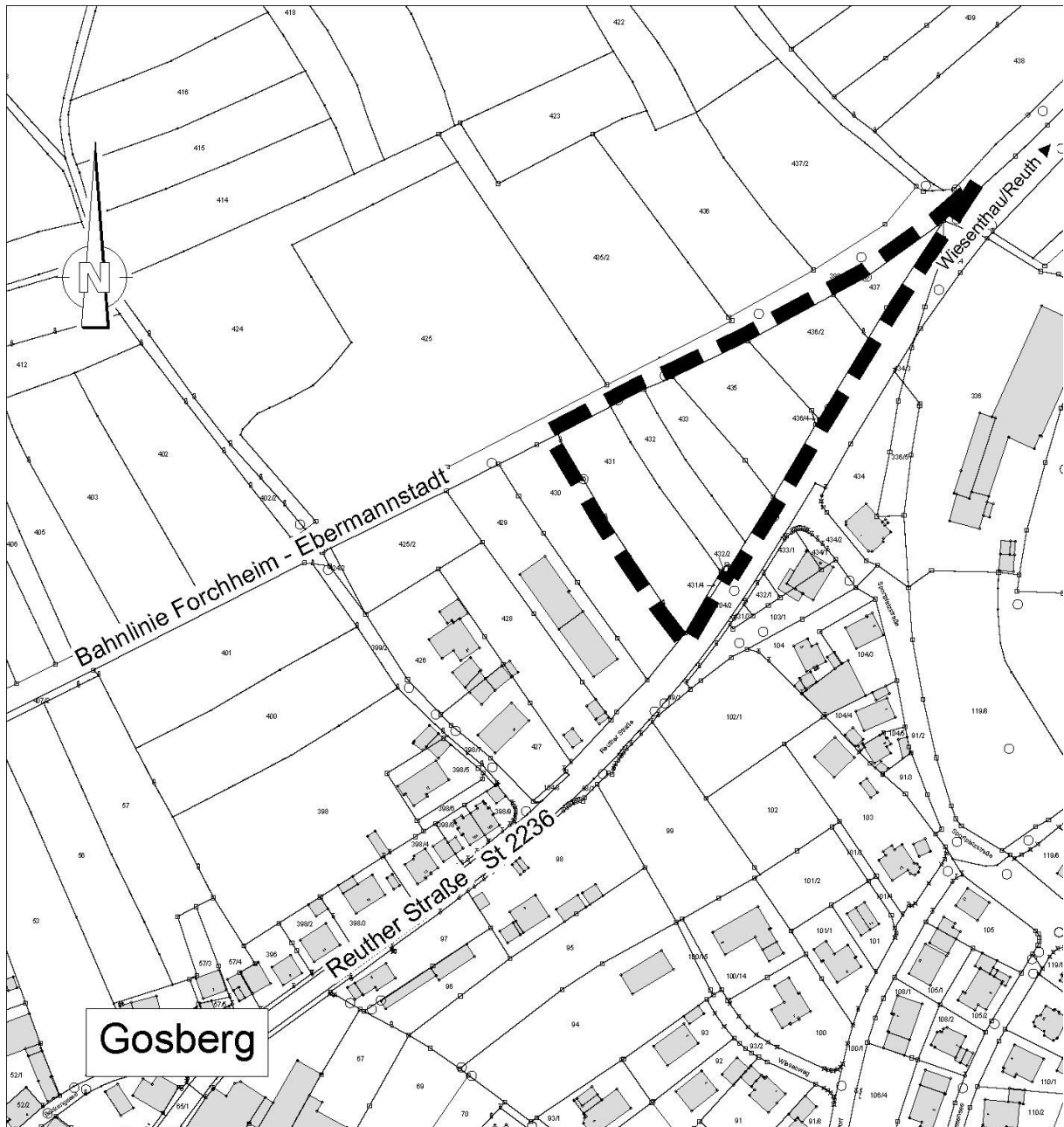
Abb. 1: Übersichtskarte Geltungsbereich Flächennutzungsplanänderung